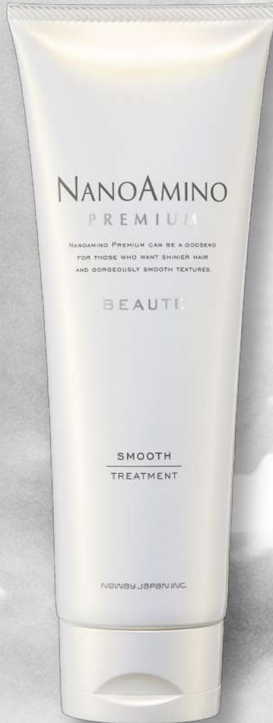
ナノアミノプレミアム ポーテ スムーズトリートメント

250ml 3,520円(税抜価格3,200円) 500ml 5,280円(税抜価格4,800円)