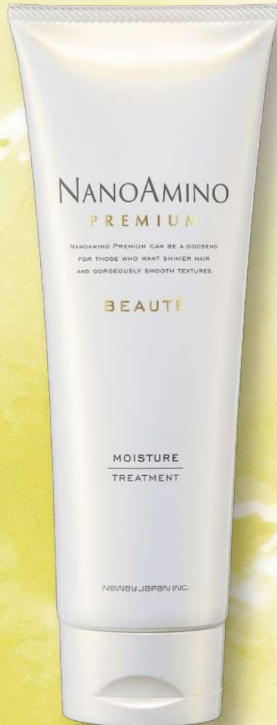
ナノアミノプレミアム ボーテ モイスチャートリートメント

250ml 3,520円(税抜価格3,200円) 500ml 5,280円(税抜価格4,800円)