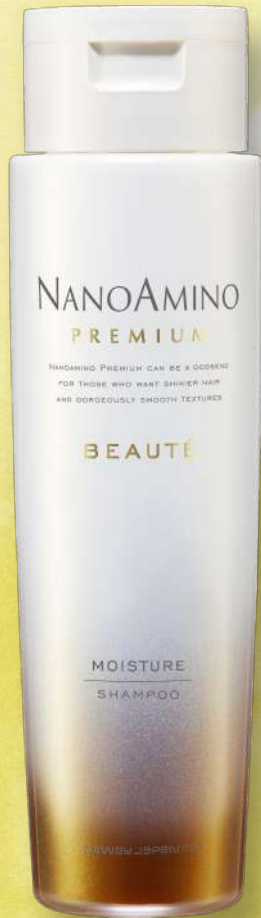
ナノアミノプレミアム ボーテ モイスチャーシャンプー

250ml 3,520円(税抜価格3,200円) 500ml 5,280円(税抜価格4,800円)