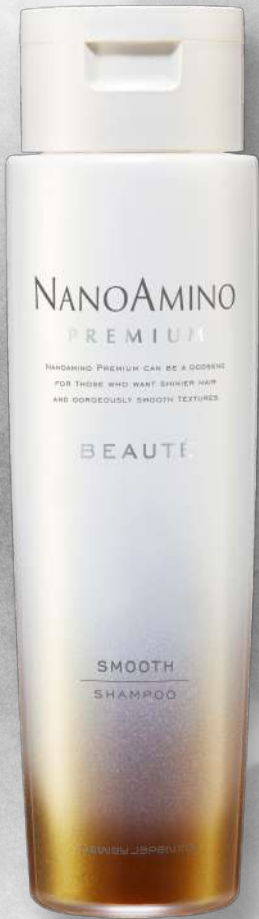
ナノアミノプレミアム ポーテ スムーズシャンプー

250ml 3,520円(税抜価格3,200円) 500ml 5,280円(税抜価格4,800円)